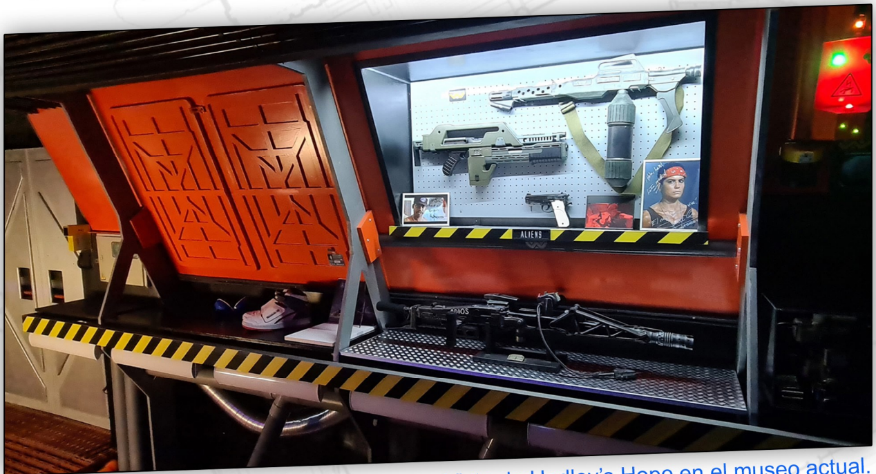
Vista de Hadley's Hope en el museo actual.

El proyecto necesitará contar con unos 1000 m2 aprox.