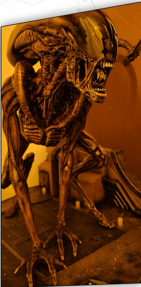
Estatua Dog Alien (museo actual).

Sin duda sería un espacio único en el Mundo, siendo una importante atracción turística más de Barcelona.