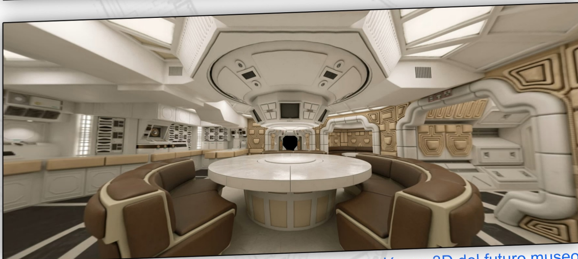
Proyección en 3D del futuro museo.