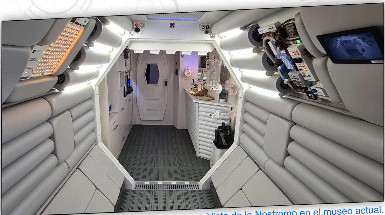
Vista de la Nostromo en el museo actual.

Están llegando peticiones para casarse en la nave o hacer las fotos de su boda, pero es un espacio muy limitado.