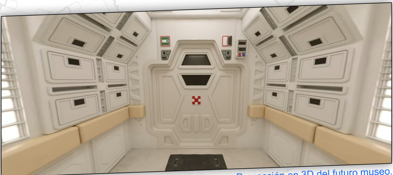
Proyección en 3D del futuro museo.

En la exposición permanente se recrearán más pasillos y escenarios basados en la película donde se vivirá la experiencia inmersiva de sentirse como parte de la tripulación. Los visitantes podrán recorrer de forma libre el museo, disfrutando así de la exposición e interactuando con los escenarios en 360°, descubriendo los secretos y curiosidades sobre el rodaje de las películas como por ejemplo de qué manera se realizaban los efectos especiales no digitales. También se ofrecerá la posibilidad de realizar visitas guiadas con anécdotas e información detallada de la saga.